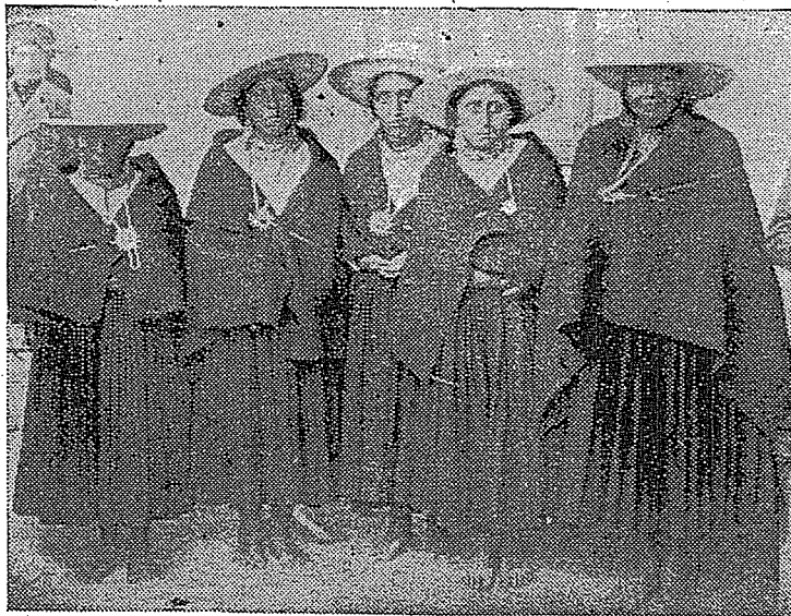
Indias de Saraguro. (Provincia de Loja)