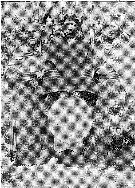
Una familia indígena de Otavalo.

El indio de Otavalo, pues, es el más conocido de todos los de la Serranía ecuatoriana. Se habla de tejidos de lana, donde él se acude. Se trata de bailes típicos, allá se va en busca de inspiraciones. Se dice de cosas prometedoras sobre el indigenismo, a Otavalo se vuelve la vista en este aspecto. Confieso con sinceridad que si por una parte este comportamiento nacional y aún internacional, que revela prestigio extendido sobre el indio otavaleño, satisface, por otra parte semejante manera de ponderaciones teóricas causa perjuicio al mismo indígena. Porque se le está acostumbrando solamente